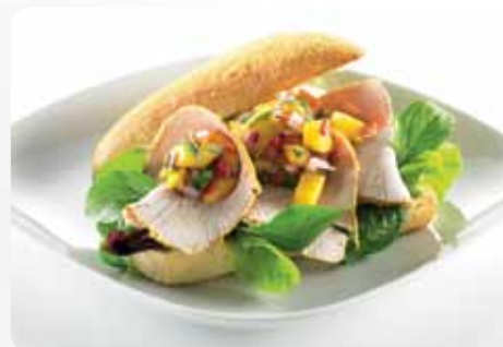
Triángulo de Maíz